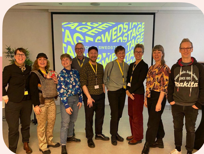
Revisit Young Swedstage på Krokusfestivalen i Hasselt, Belgien

De åtta utvalda produktionerna medverkande i Revisit Young Swedstage är: Bobbi Lo Produktion, Claire Parsons Co, Dockteatern Tittut, Kompani Giraff, Johanssons Pelargonier och Dans, Big Wind, Regionteater Väst och Stinnerbom Production.