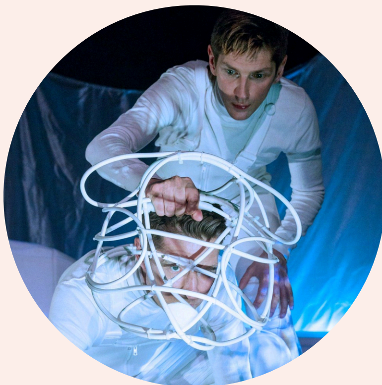
Våra medlemmar Dockteatern Tittut gästspelade med föreställningen "Snö" på Krokusfestivalen i Hasselt, Belgien

Styrelsen föreslår att årets resultat balanseras och överförs i ny räkning.