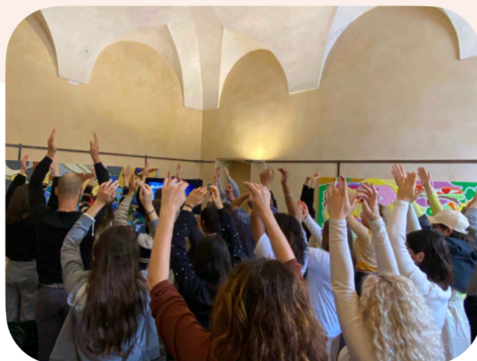
Revisit Young Swedstage på Segni d'Infanzia i Mantova, Italien