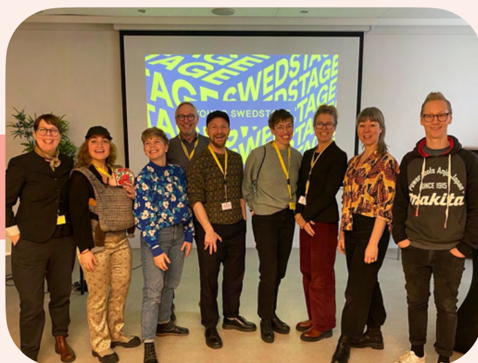
Revisit Young Swedstage på Krokusfestivalen i Hasselt, Belgien

De åtta utvalda produktionerna medverkande i Revisit Young Swedstage är: Bobbi Lo Produktion, Claire Parsons Co, Dockteatern Tittut, Kompani Giraff, Johanssons Pelargoner och Dans, Big Wind, Regionteater Väst och Stinnerbom Production.